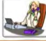
Un secrétaire سكرتيرة